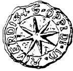
Siegel der Stadt Alverdissen von 1370