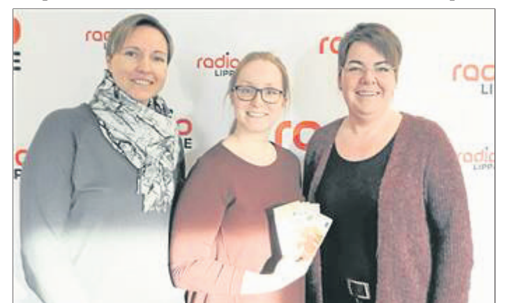
230 Euro bekam die Aktion „Lichtblicke“.

Die nächsten Basare finden am 30. und 31. März statt.