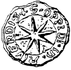
Siegel der Stadt Alverdisen von 1370